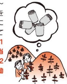
約841本分の植林活動費に相当します。^_^)-☆

住みやすい「地球環境」と「暮らし」を考え、創業以来一環して環境商品に携わってきました。