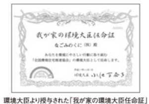
環境大臣より授与された「我が家の環境大臣任命証」

当社の企業理念は「私たちはすべての事業を通して“みなさんの暮らす町”を明るく元気にします」です。1人ひとりの力はわずかですが、行動・実践することで少しでも地球環境を守ってお手伝いをしたいと考えています。